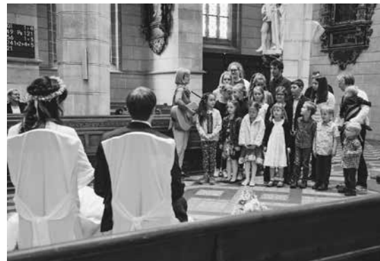
Die Kinderkirche feiert im Mai die Hochzeit mit ihrer Kinderkirchmitarbeiterin

Wer an ehrenamtlicher Mitarbeit interessiert ist, kann sich gerne an die Diakonische Bezirksstelle, Neue Straße 23, Telefon 0 71 25 / 94 87 61 wenden.