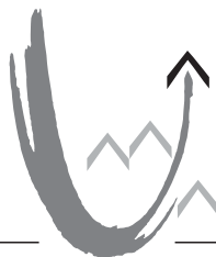
Benefizkonzert zugunsten der Sanierung der Amanduskirche