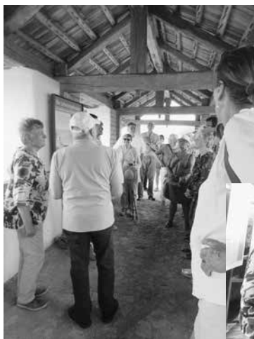
Gemeindeausflug auf die Heuneburg und nach Hayingen