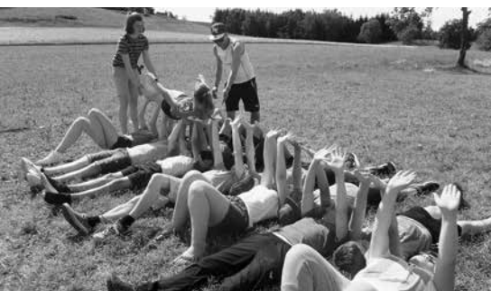
Vorkonfirmandenfreizeit auf dem H"ochsten